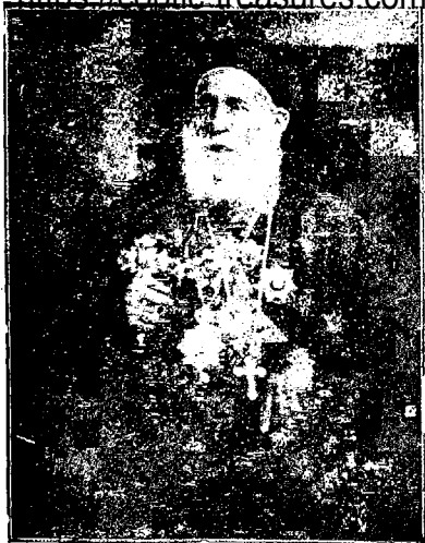
قداسة البابا ، الانبا يوانس ، بابا و بطريرك الكرازة المرقسية