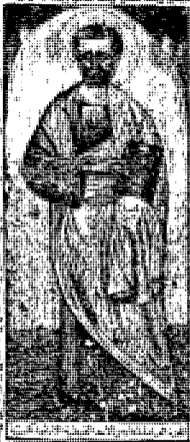
القديس مرقس الانجيلي مؤسس الكنيسة المصرية